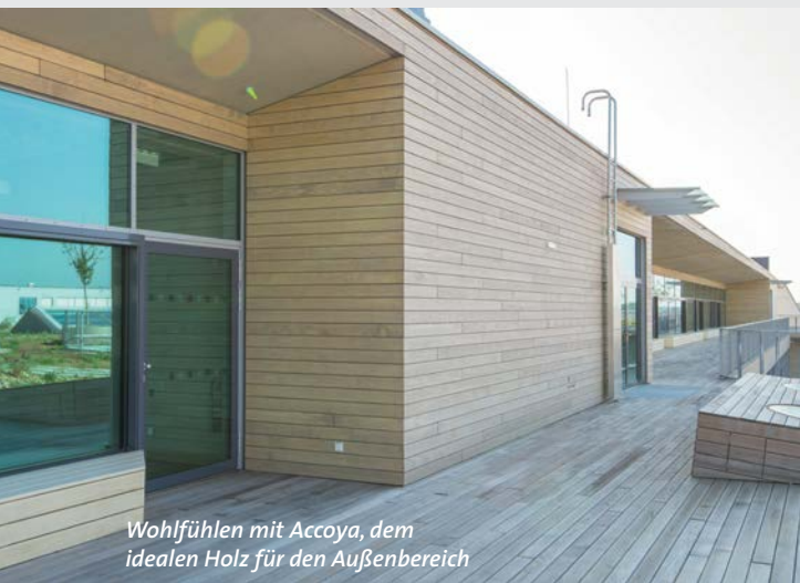
Wohlfühlen mit Accoya, dem idealen Holz für den Außenbereich

Im Sommer 2017 wurde in der Seestadt Aspern das Bundesrealgymnasium des „Bildungscampus“ fertig gestellt. Der Bildungscampus vereinigt Kindergarten, Ganztagsvolksschule, sonderpädagogisches Zentrum, Bundesschule und allgemeinbildende höhere Schule in einem Komplex. 1.100 Schüler sollen hier Platz zum Lernen finden.