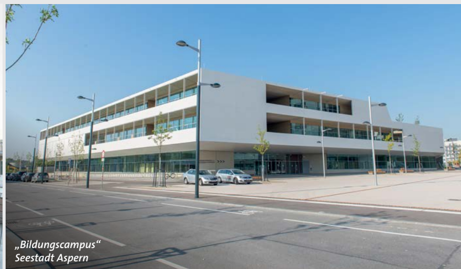
„Bildungscampus“ Seestadt Aspern

Das Bundesrealgymnasium bietet einen besonderen Blickfang. Erwin Eibl von der Firma M. Hechenblaickner Holzhandels GmbH, Graz berichtet stolz, dass bei der Umsetzung dieses Großauftrages 2.800 m 2 Fassadenfläche nicht sichtbar verschraubt wurden. 100 m 3 Accoya Rhombus-Profile wurden mit 35.000 Stück RomboFix aus dem Hause SIHGA befestigt. Außerdem kam Accoya für Sitzbänke im Innenbereich zum Einsatz und Außentüren wurden mit Accoya 3-Schichtplatten belegt.