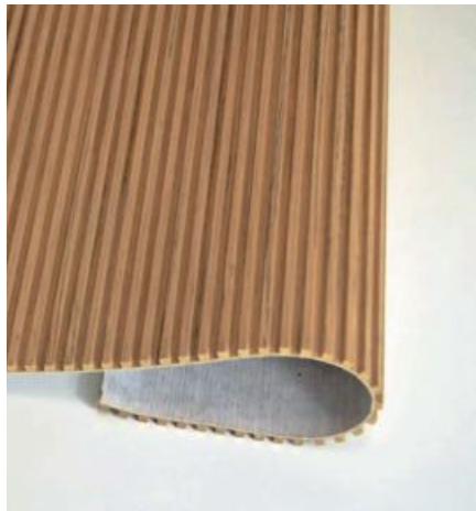
Unverwechselbare Oberflächen: Gefräste Massivholzdecklagen von Latho sind in Österreich nun exklusiv bei Hechenblaickner erhältlich. Im rechten Bild sieht man das Modell „Capri“ in einer Anwendung.

FURNIERE Produkte des italienischen Herstellers Latho gibt es in Österreich ab sofort exklusiv bei Hechenblaickner.