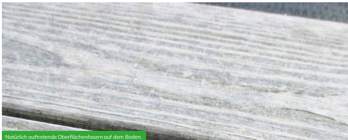
Natürlich auftretende Oberflächenfasern auf dem Boden.

Je höher die Menge oder die Intensität der UV-Oberfläche ist, desto schneller entwickelt sich dieser Prozess. Es ist anzumerken, dass diese Fasern auf allen exponierten Holzarten, einschließlich Accoya®, insbesondere auf flachen Oberflächen, wie Böden gebildet werden. Ein geripptes Bodenprofil neigt dazu, diese Fasern anzusammeln, was es umso auffälliger macht.