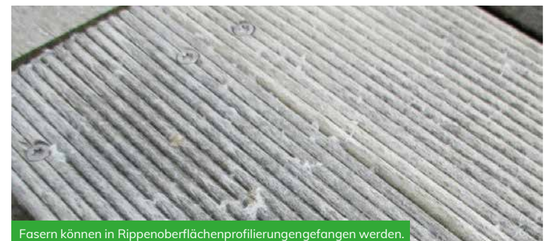
Fasern können in Rippenoberflächenprofilierungengefangen werden.

In all diesen Fällen ist die Haltbarkeit des Accoya® Holzes in keiner Weise beeinträchtigt. Jedoch empfiehlt es sich, regelmäßig alle losen Fasern zu entfernen, da diese sich an einem Ort sammeln, wo sich dann Organismen niederlassen, was zur Verunstaltung des Holzes führen kann.