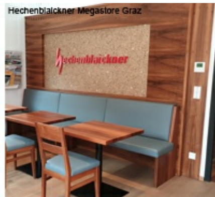
Hechenbläckner Megastore Graz