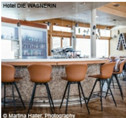
Hotel DIE WASNERIN