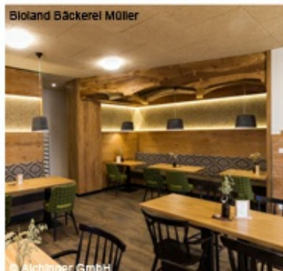
Bioland Bäckerei MÖller