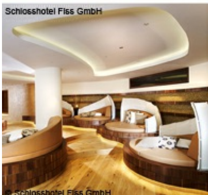
Schlosshotel Flass GmbH